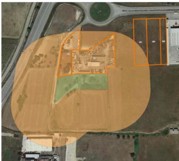
6) Proposta di nuova perimetrazione

Alla luce di quanto detto sopra e in seguito alla rettifica di cui alla DGR. n. 1632 del 08.10.2020, si rileva che l'area di intervento ricade in: